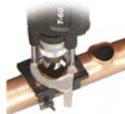
Vyhrdlovacie systémy a spracovanie trubiek