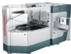
Panelová ohýbačka P1