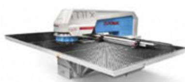
Dierovacie stroje MTX Flex12 a BX Multitool